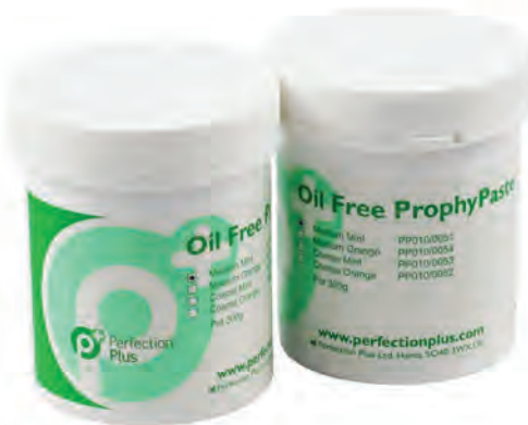
Prophy paste cup Pojemnik do pasty polerskiej